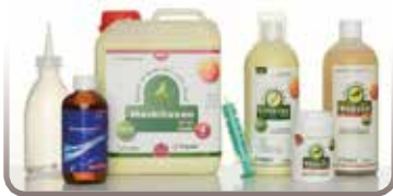
Ökozon NEO Typ 4 1/2 Großpackung

Die NEO klassische Kompaktfutter- und Pflegemittelkombination bei Sommerexzem