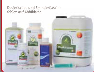
Die Großpackung Ökozon NEO