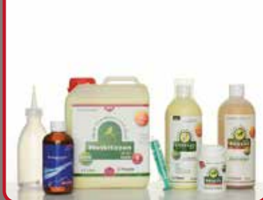
Die 1/2 Großpackung Ökozon NEO Typ 4