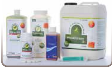
Ökozon NEO Großpackung