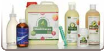
Ökozon NEO 1/2 Großpackung

Die NEO klassische Kompaktfutter- und Pflegemittelkombination bei Sommerexzem